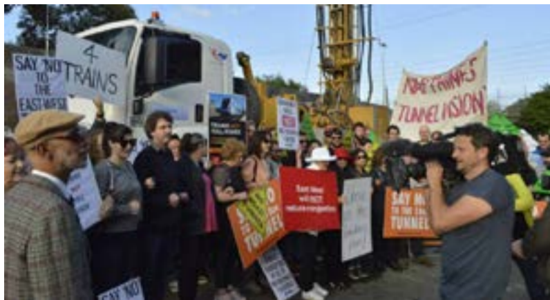
Protes komuniti tempatan bersama ahli-ahli CWI Australia

Pilihan raya negeri Victoria pada 29 November 2014 menyaksikan pemilihan Parti Buruh (Labor Party) sebagai kerajaan negeri baru, yang telah berjanji untuk menamatkan pembinaan projek lebuhraya Timur-Barat bertol di Melbourne, Australia. Pemberhentian projek ini merupakan sebuah kejayaan besar bagi kumpulan kempen komuniti dan aktivis yang telah bertungkus-lumus dalam menyuarakan bantahan terhadap pembinaan lebuhraya itu. Kempen anti-lebuhraya bertol tersebut telah di anjur dan dimobilisasikan oleh Socialist Party (seksyen CWI di Australia).