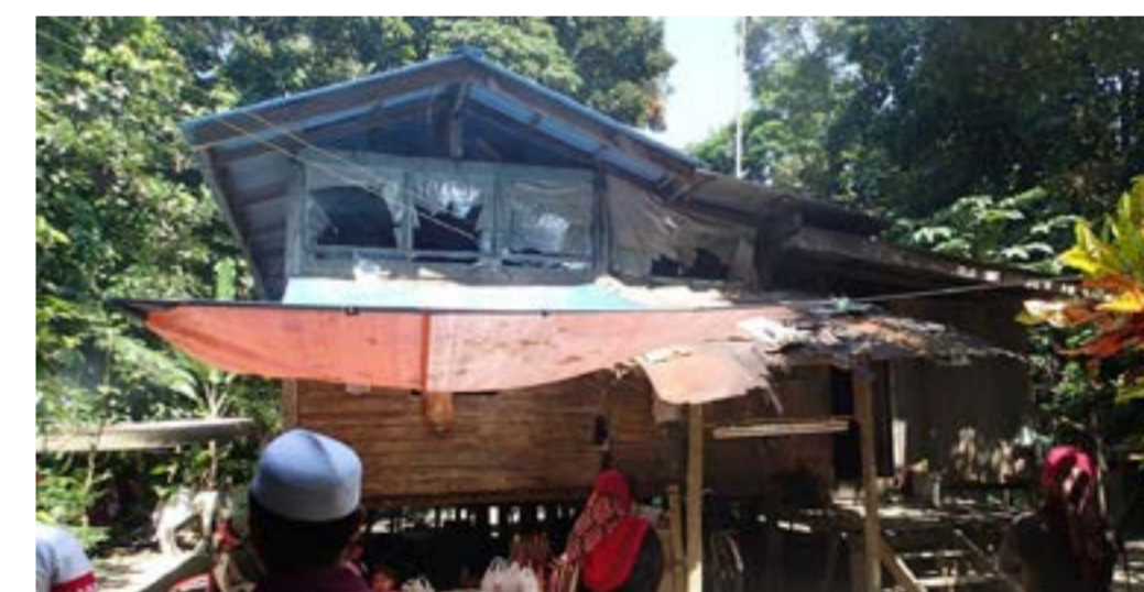
Rumah usang di Pasir Mas, Kelantan

Kerajaan PAS di Kelantan dijangka akan membawa isu Hudud ke parlimen untuk mendapatkan sokongan majoriti bagi membolehkan Hudud dilaksanakan di negeri Kelantan. PAS beranggapan bahawa dengan Hudud, gejala sosial yang semakin meningkat di Kelantan dapat dibendung.