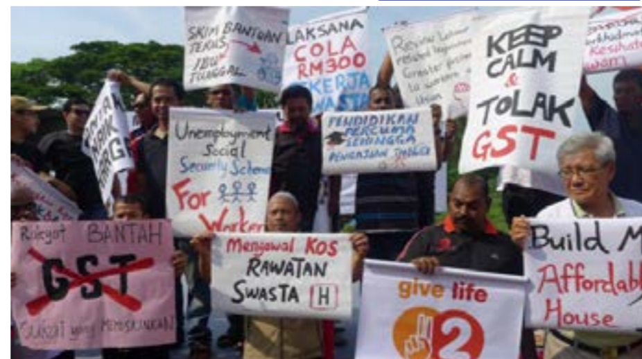
Demonstrasi rakyat pada Hari Mei 1 tahun lepas

Tahun 2015 dijangka akan memberikan lebih banyak beban terutama kepada warga