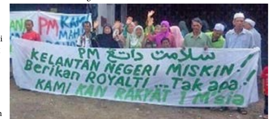
Rakyat Kelantan meluahkan rasa tidak puas hati mereka

ia tidak mampu menyelesaikan kemiskinan dan masalah ekonomi yang sedang melanda rakyat Kelantan. Ini kerana PAS tidak mempunyai alternatif kepada sistem ekonomi kapitalis. Hanya dengan merancang ekonomi secara demokratik berlandaskan kepada keperluan dan kebajikan rakyat di Kelantan dan di negeri-negeri lain, satu penyelesaian kepada kemiskinan dan masalah sosial yang lain dapat dicapai. Solidariti daripada kelas pekerja dan rakyat biasa di Kelantan dan di negeri-negeri lain perlu dibina untuk berjuang ke arah tersebut.