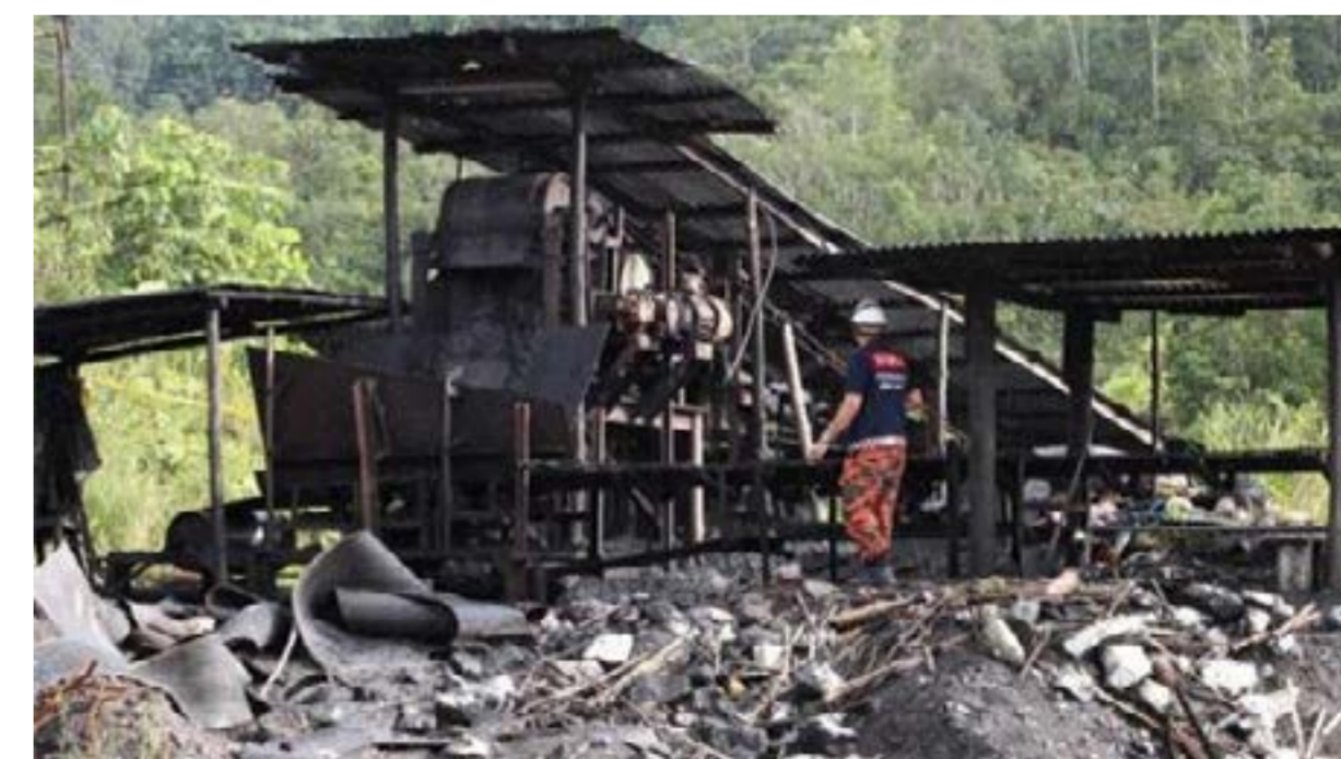
Anggota keselamatan sedang memeriksa salah sebuah letupan lombong arang batu di Sarawak

diarahkan memberhentikan segala kerja-kerja oleh Jabatan Mineral dan Geosains untuk memberi ruang kepada penyiasatan punca letupan. Adalah dimaklumkan, lombong ini telah beroperasi selama